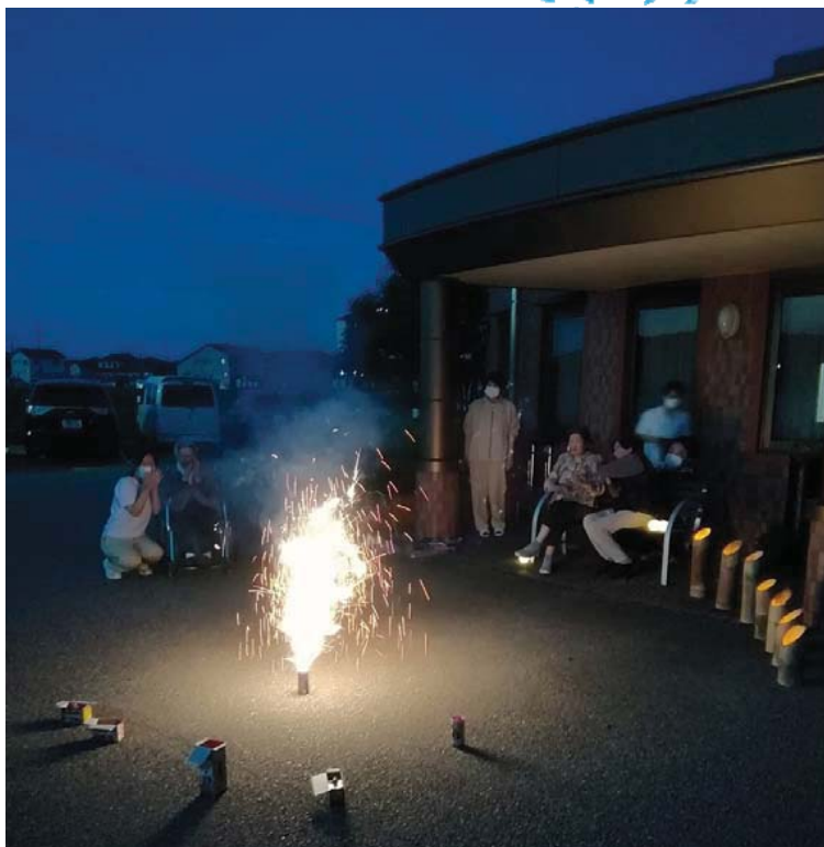
<ほのぼの苑正面にて>

今年の夏は暑さの厳しい日が続きました。当施設では、新型コロナウイルス感染症拡大がはじまってから、職員が工夫し、利用者さんに楽しんでいただけるようにイベントを実施しています。施設の最大行事である納涼祭は本年も開催できない状況となりました。