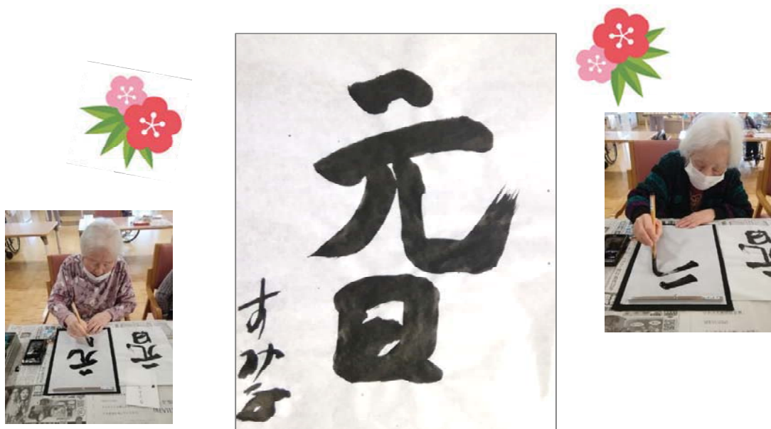
ホーム利用者様による書初め