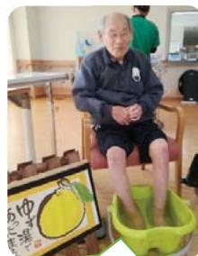
ゆずで足湯もやりました！

りんご農園をしている職員から沢山のりんご、柚子を育てている職員からも、柚子をいただいたので、お風呂に浮かべてりんご湯・ゆず湯を行いました。りんご、柚子のいい匂いが広がります。りんごは沢山いれてとても贅沢なお風呂になりました。「より身体が温まる」「りんごくれた人に感謝や」「なんて贅沢なお風呂や」と、利用者様から大好評。心もリラックスしたような表情をしておられ、のんびりとお風呂を楽しまれていました。